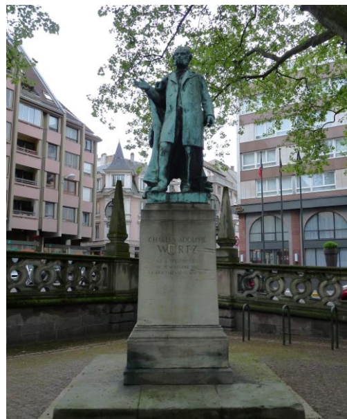
Biographie de Charles Adolphe WÜRST

Charles Adolphe Wurst, né à Strasbourg le 26 novembre 1817 et mort à Paris le 12 mai 1884, est un médecin et chimiste français d'origine alsacienne. Il fut professeur et doyen de la Faculté de médecine de Paris, professeur à la Sorbonne, et membre de l'Académie de Médecine.